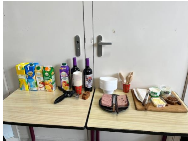
Hapjes en drankjes voor de vrijwilligersbijeenkomst