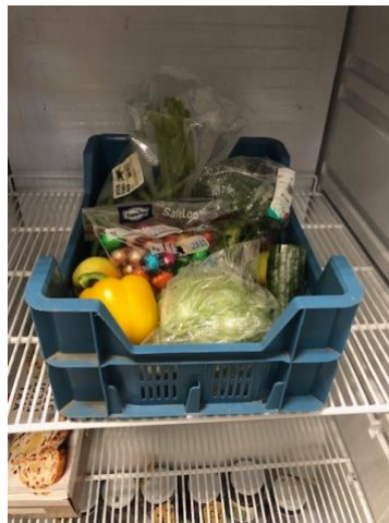
Klein deel van het resultaat