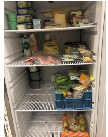
Hoop voor morgen in ZO