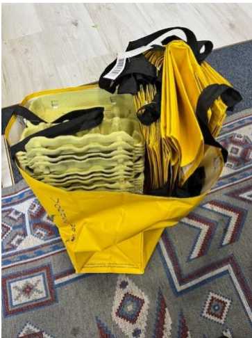
Op naar de voedselbank