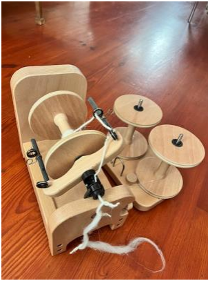
Elektrisch spinnen wiel